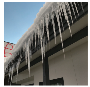
写真は本文とは全く関係ない寒河江のつららです