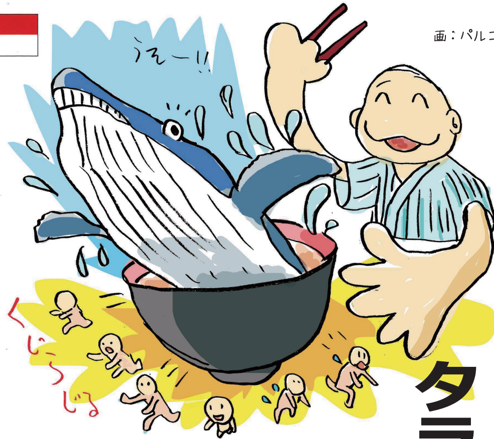
画：パルコキノシタ