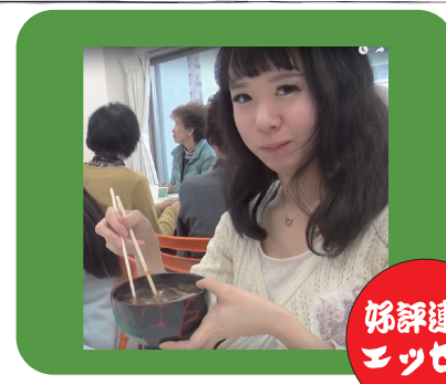
姉評連載 エッセイ

「春眠暁を覚えず」ということで、春は毎日眠くて仕方ありません。この時期の眠さは何なのでしょう。夢の中では何回も現実世界へ起きようとするんです。目を開けて体を起こすものの、体がふわふわ浮いてるみたい。廊下に、いるはずのない犬がいたり、窓を開けると一面海だったりして…あーこれも夢なのか、起き直してやる…の繰り返し。寝てる間に夏にならないようにしないとイケないですね。今年の春はきつと短い。