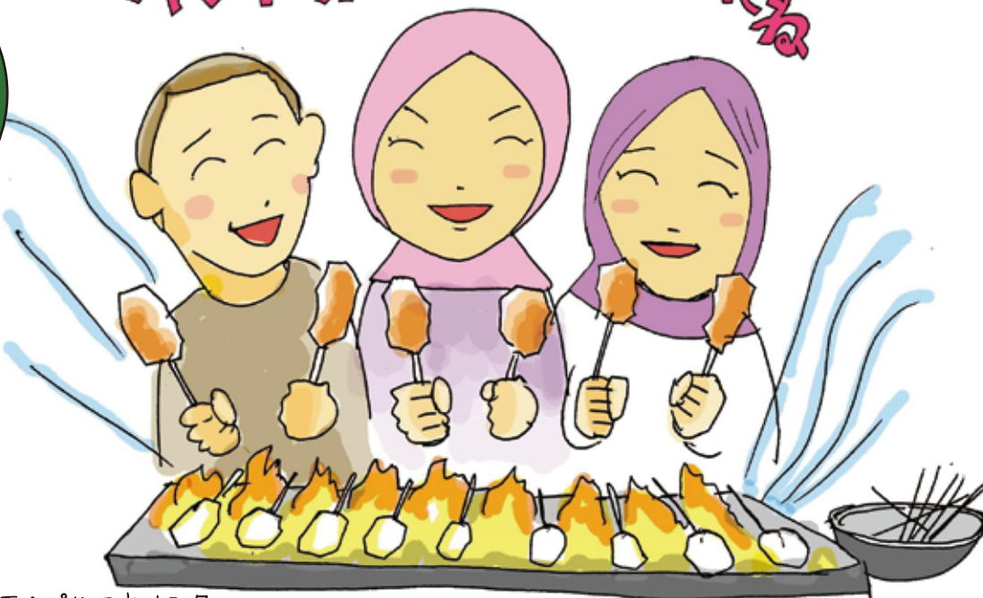
画：パルコキノシタ

先月の手作りハンバーグ、美味しかったですね。 さて、今月は2004年のスマトラ沖地震の被災地インドネシアはアチエから3人の若者が来日します。美味しいソースにつけて食べるアチエ名物の牛串「サテ・マタン」を作ってくれませう！辛いのでどなたにもおすすめ！そしてデザートは宮城名物ずんだ。 この美味しい国際交流にはどなたでも無料でご参加いただけます。ぜひ誘い合わせの上おこしくください！