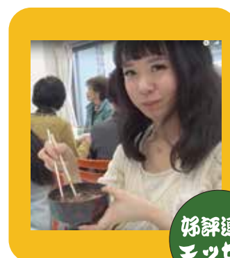
姉評連載 エッセイ

先日、初めてお店でキンモクセイ関連のグッズに興味を持ちました。去年の今頃、街路樹からふわりとした甘い香りがして、ああこれがキンモクセイなんだと、しっかり知ったばかりだったので。そのお店では、精油を使ったルームスプレーを作りました。キンモクセイの精油は大変高価で、5mlで数千円だから。だから他の柑橘系の精油に混ぜて作りました。寝室で使ってみると、甘くてさっぱりした香りが枕に降りてきました。キンモクセイを見つけた時も夜だったな…。空気の澄んだ秋のちよっとした楽しみです。