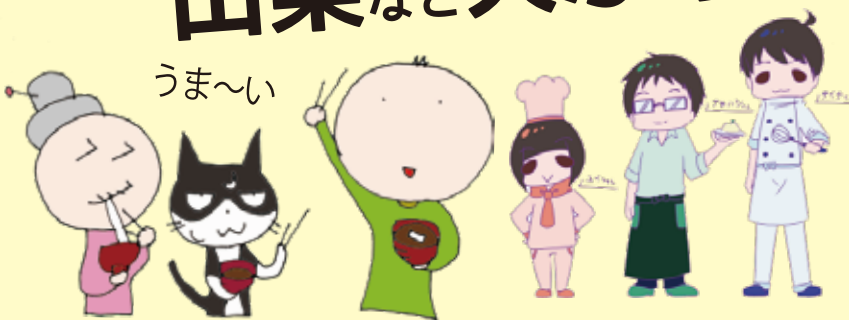
画：パルコキノシタ