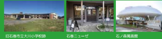
旧石巻市立大川小学校跡

東日本大震災を伝える施設や芸術文化施設など 社会観光の拠点としてぜひご活用ください！