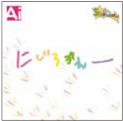
アイドル・インクルージョン 「ザ・ベスト」