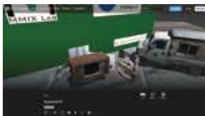
MMIX ＜3Dバーチャルギャラリー＞