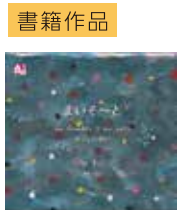
書籍作品 まい 「まいそーと2」