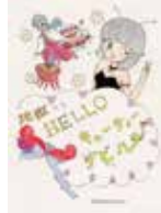
書籍作品 SAKURANEKO 「地獄から Hello!」