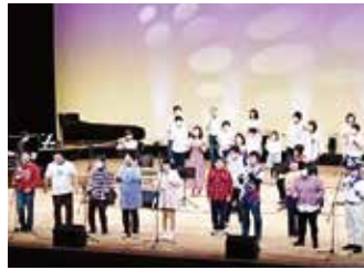
Ai ファクトリー 「なんでもありさん」